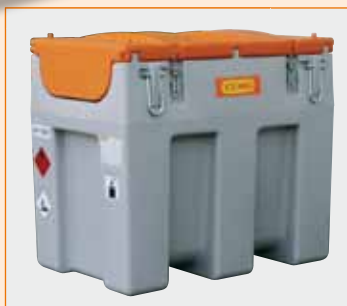
DT-Mobil Easy 600l mit Elektropumpe, Automatik-Zapfpistole und Klappdeckel