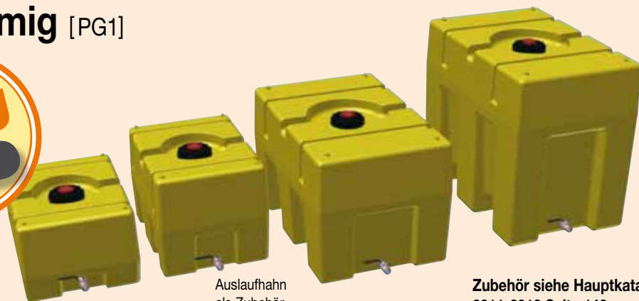
Auslaufhahn als Zubehör

Zubehör siehe Hauptkatalog 2011-2012 Seite 146.