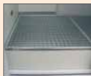
Bodenwanne mit verzinktem Gitterrost, Auffangvolumen: 220 l