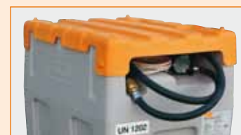
DT-Mobil Easy 200l mit Elektropumpe 12V, Automatik-Zapfpistole und Klappdeckel