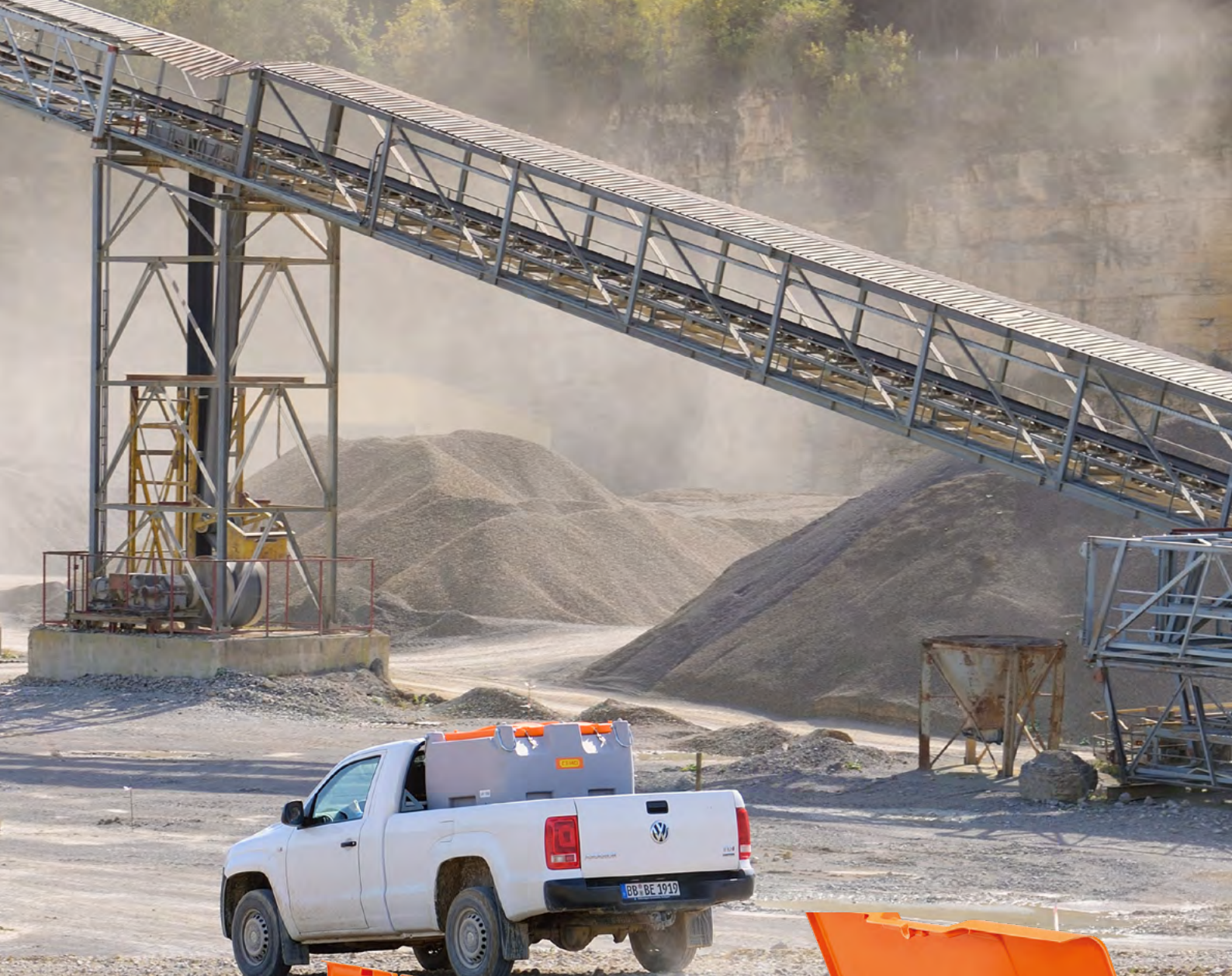
DT-MOBIL EASY 210 I