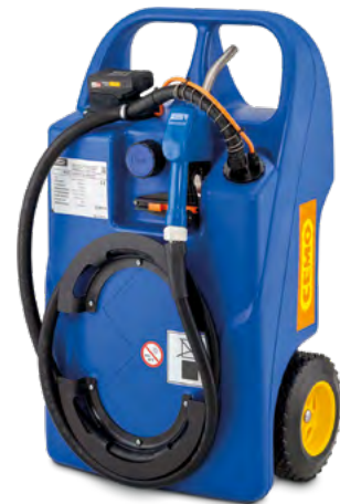
Trolley für AdBlue® 60 L