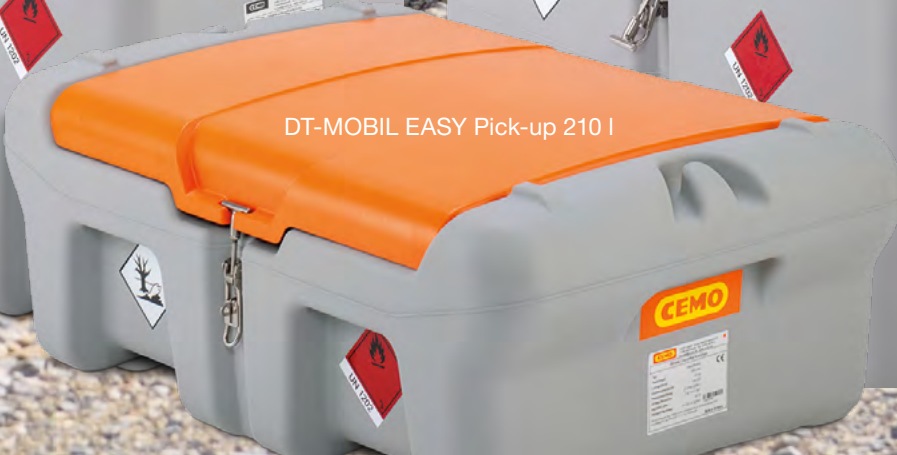
DT-MOBIL EASY Pick-up 210 I