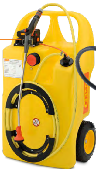
Aqua-Caddy 60 l