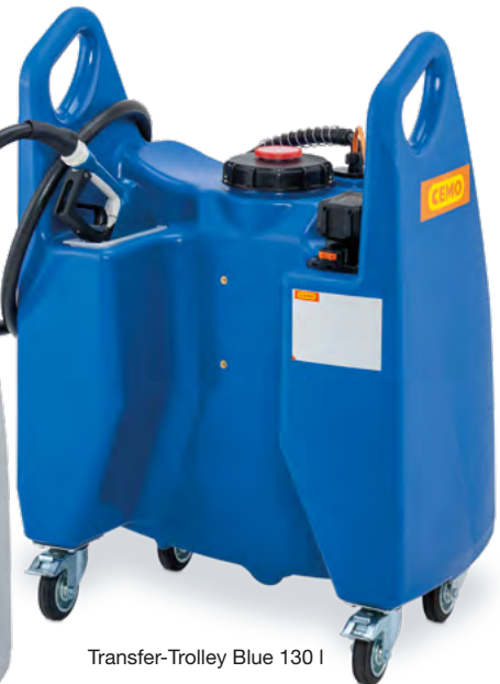
Transfer-Trolley Blue 130 l