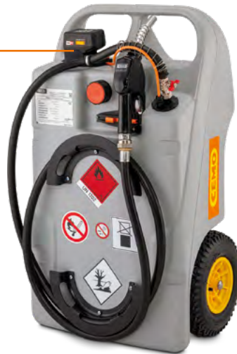
Dieseltrolley 100 L