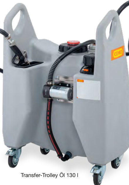
Transfer-Trolley Öl 130 l